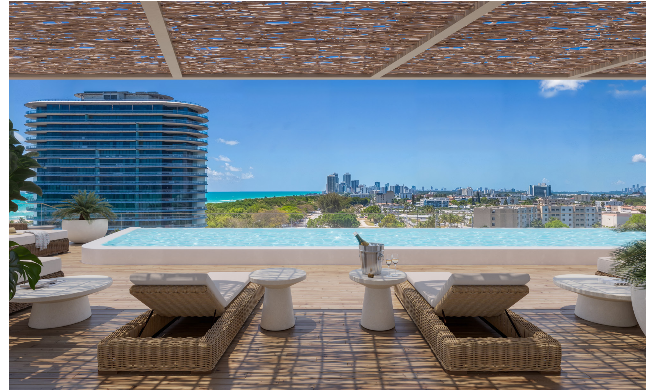
PISCINA & ROOFTOP